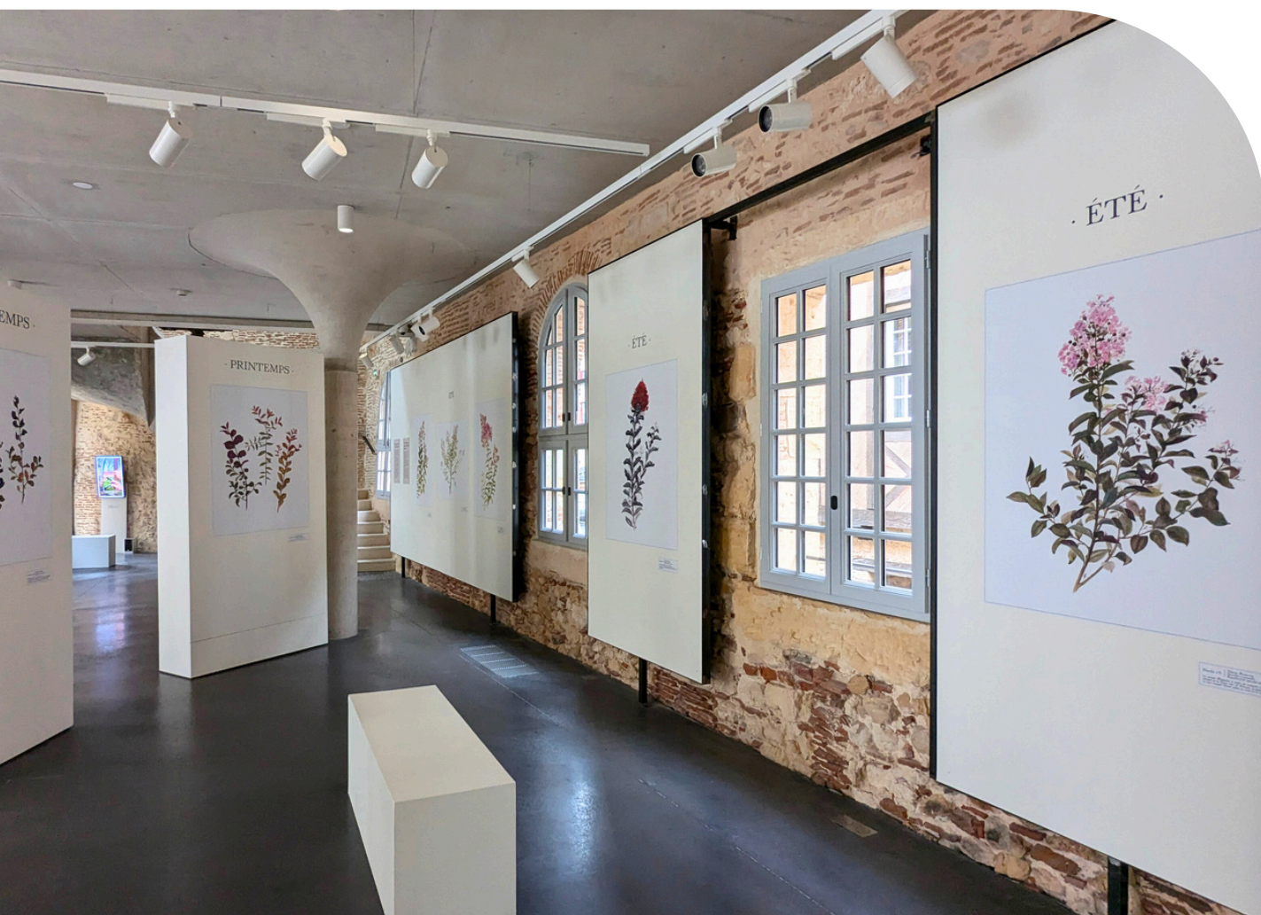
Expo d'été 2024, Les quatre saisons du Lagerstroemia