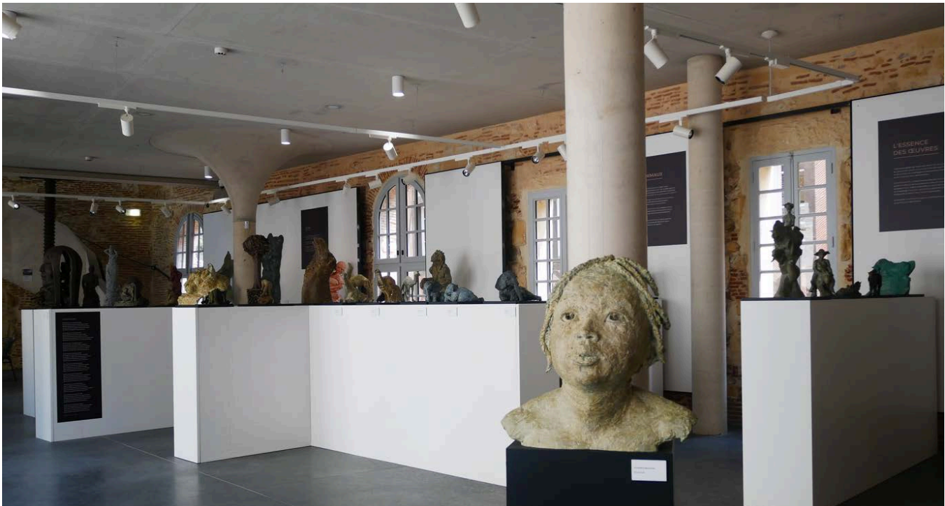
Expo d'été 2023, VALEM (sculpture), vues générales